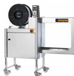
SMG 65i, 65iS Como máquina autónoma ou para integração em sistemas de transportadores