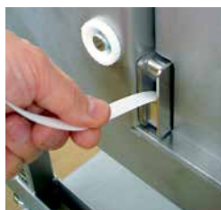
Rápida mudança da bobina, sistema de enfiamento automático