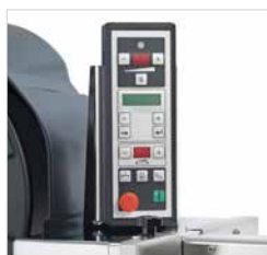
Ajustes simples através do painel controlo