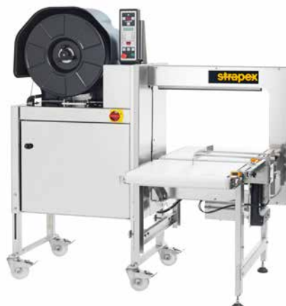
SMG 75i / SMG 75iS