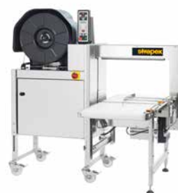
SMG 75i, 75iS Com transportador de tela para integração em linhas completamente automáticas