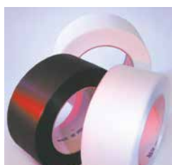
Cintas adequadas para uma cintagem económica Utilização de cintas finas de PP