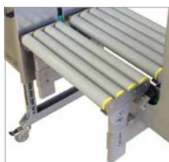
Várias opções Adaptáveis a diferentes aplicações e condições operacionais

Máquina, Cinta e Assistência Técnica como um pacote global