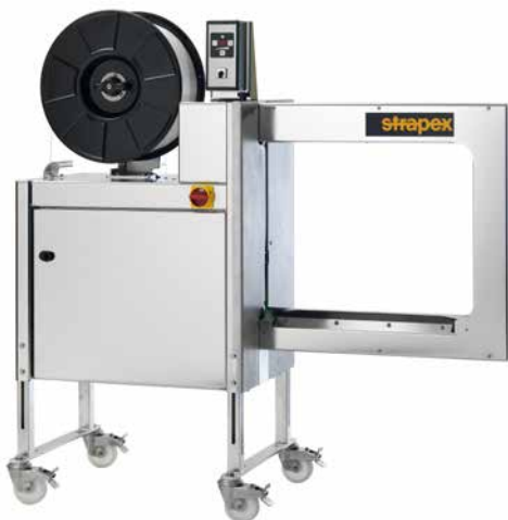
SMG 65i / SMG 65iS