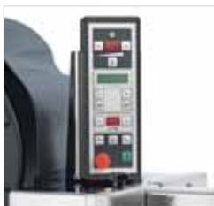
Ajustes simples através do painel controlo