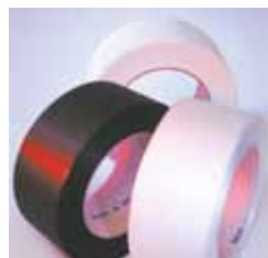
Cintas adequadas para uma cintagem económica Utilização de cintas finas de PP