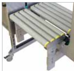
Várias opções Adaptáveis a diferentes aplicações e condições operacionais

Máquina, Cinta e Assistência Técnica como um pacote global