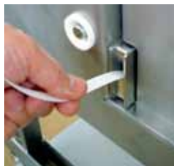
Rápida mudança da bobina, sistema de enfiamento automático