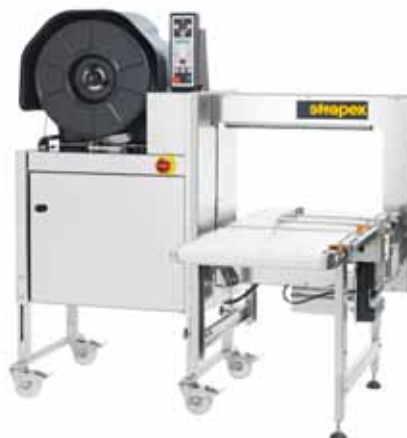
SMG 75i / SMG 75iS